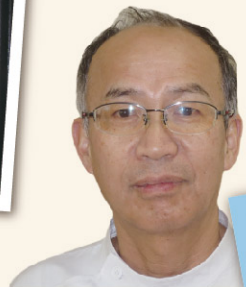
砥部病院 磯金 新

店名 蔵グルメ あこう 住所 愛媛県伊予郡砥部町麻生275-1 営業 9:30 ~ 21:30(L.O.21:00) TEL 089-905-1560